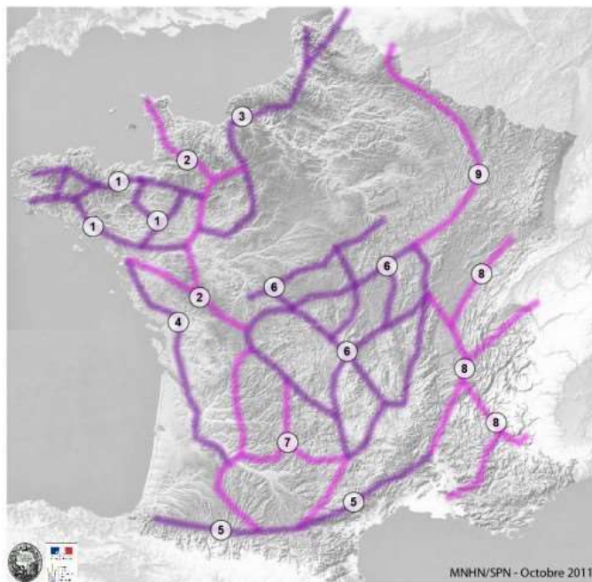
Figure 4 : Illustration des continuités écologiques bocagères d'importance nationale pour la cohérence nationale de la Trame verte et bleue